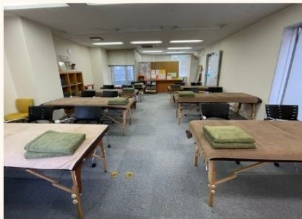
フランシラ日本校