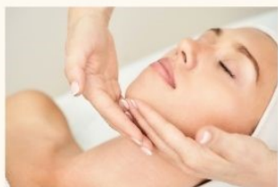
北欧式マッサージ