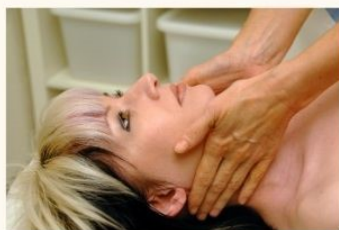
リンパドレナージ